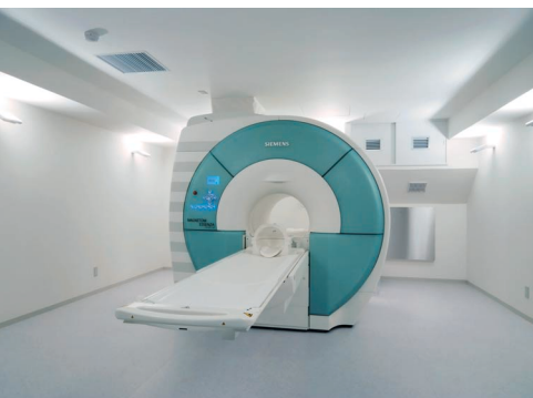
シーメンス社製マグネトムエッセンザ 1.5 テスラMRI